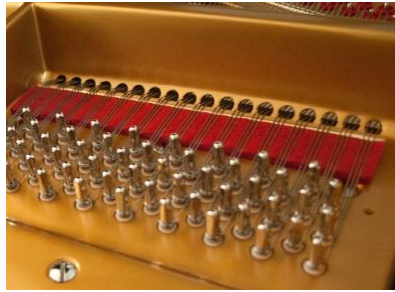
Fig.: A sound reflecting rim, a strictly limited soundboard and pressure bar bridges.